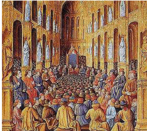
Papa Urbano preside o Concílio de Clermont, iniciando a primeira cruzada.

europeu, e com ele, a Supremacia Temporal do Papa de Roma.