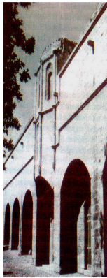
Castelo dos Cavaleiros. Situado na antiga cidade de Rodes, restaurada pelos italianos em 1940

❖ Hopitalários: Formada de uma associação monástica, seu objetivo era de socorrer os pobres e enfermos dentre os peregrinos que viajavam para o Oriente. Os monges usavam uma cruz em suas vestes e andavam com uma espada à cinta. Lutavam, quando necessário, embora se dedicassem principalmente a socorrer os peregrinos doentes. No século treze, quando a Síria, principalmente, foi evacuada pelos cristãos, os Hospitários mudaram sua sede para a ilha de Rodes, e mais tarde para Malta. Esta ordem ainda existe e seu emblema é a Cruz de Malta.